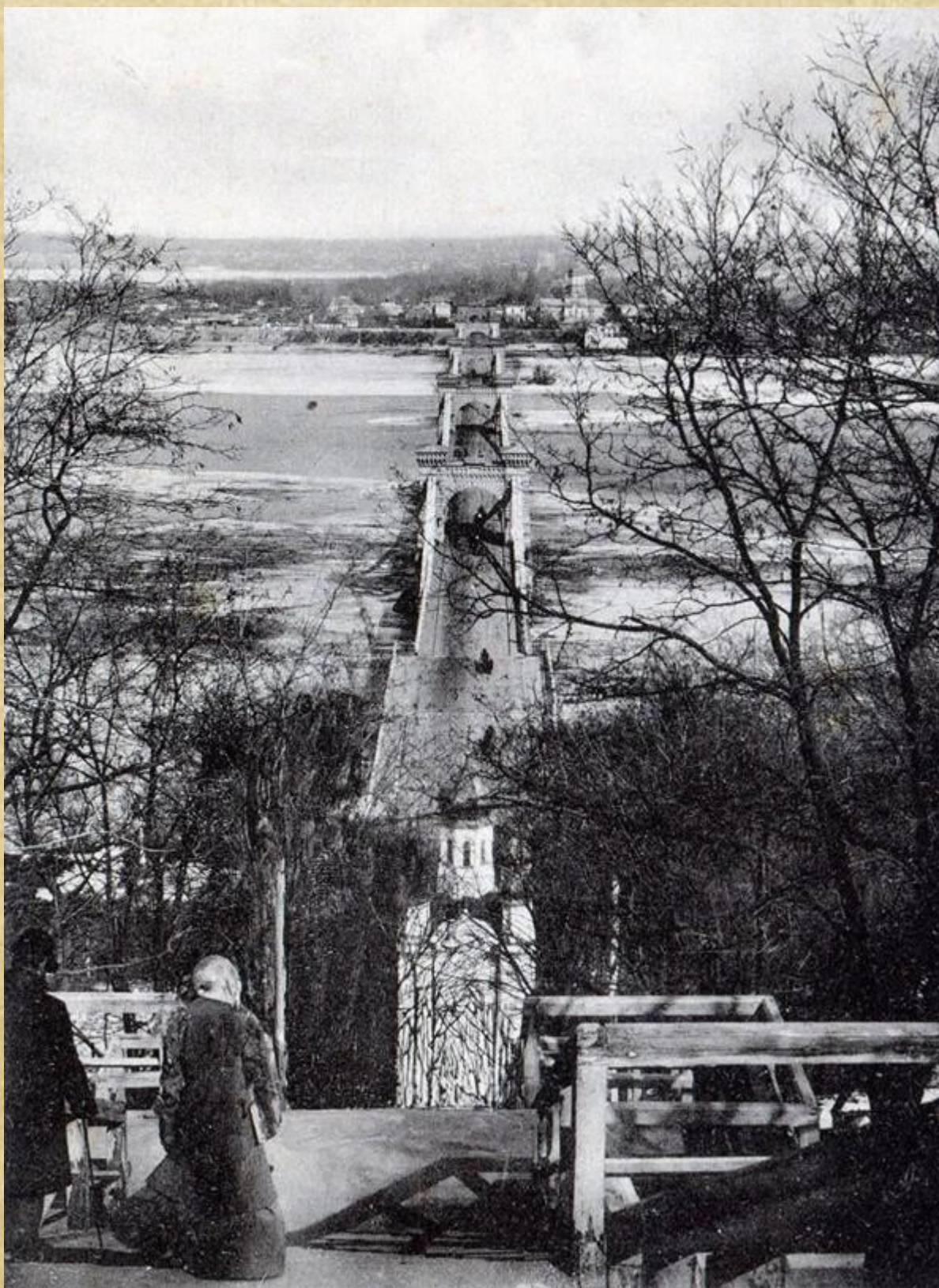
1910-ті роки. Внизу – каплиця Святого Миколая