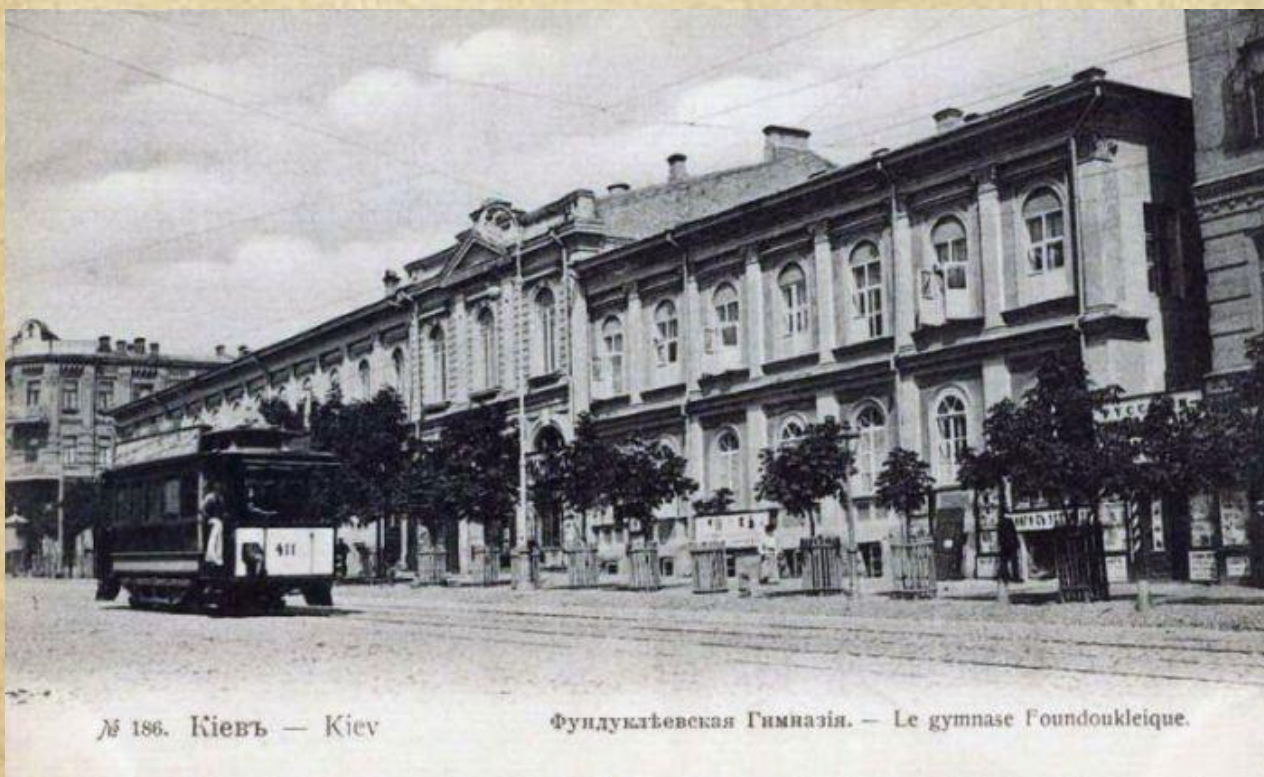
Фундуклеївська жіноча гімназія, початок 20 століття.