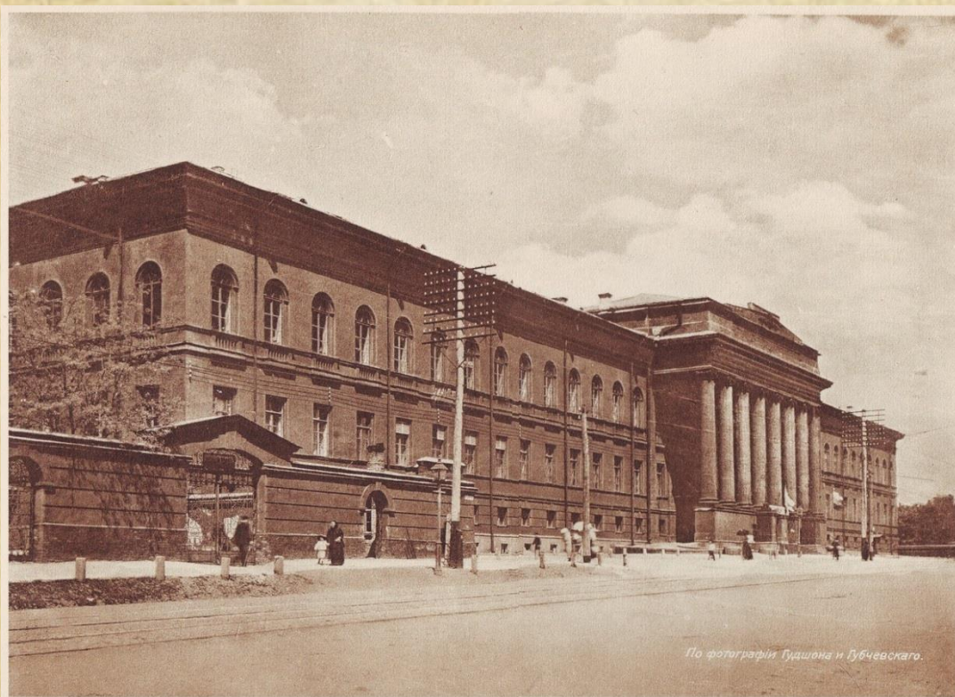
Императорскій Университетъ Св.Владимира.

Забудова міста за часів губернаторства Івана Фундукля велася найбільш інтенсивно. Багато будівель було зведено за проектами знаменитих архітекторів Беретті, батька і сина: Імператорський університет св. Володимира (1842), Інститут шляхетних дівчат (1843; з 1958-го це Жовтневий палац), обсерваторія, Анатомічний театр (1851-1853).