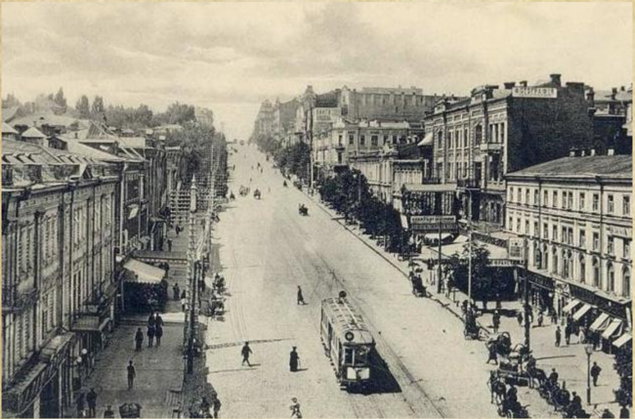
Вулиця Фундуклеївська (нині Богдана Хмельницького), 1900-і рр.

Діяла Фундуклеївська гімназія до встановлення в Києві радянської влади. 1869 року на честь губернатора, ще за його життя, вулицю Кадетську перейменували на Фундуклеївську (зараз вул. Богдана Хмельницького). Через 20 років після переведення Фундукля з Києва до Варшави Київська міська дума постановою від 19 жовтня 1872 року одногolosно обрала його почесним громадянином міста.